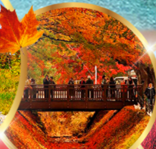
อุโมงค์เมเปิ้ล