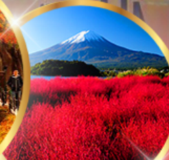
โออิชิ พาร์ค