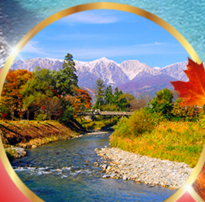
โออิตะ พาร์ค