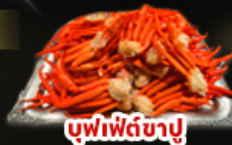
บุฟเฟ่ต์ขาปู

พักทาคายาม่า 1 คืน | พักนาโงย่า 1 คืน พักฟูจิ 1 คืน | ออนเซ็น 2 คืน