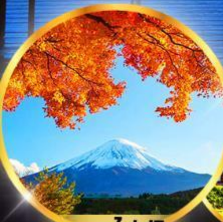
กุมฮาไฟฟูริ