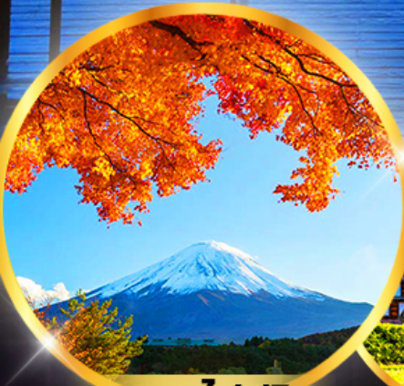
ภูเขาไฟฟูจิ