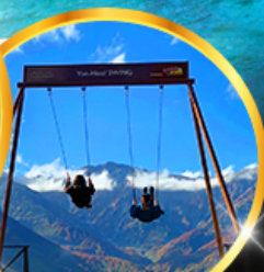
Yoo hoo! Swing