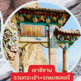
เขาวงกต รวมกระเช้า+รถแบคเตอร์