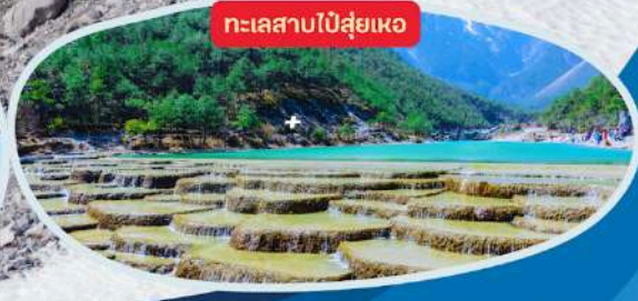
ทะเลสาบไ้สู่ยเหอ