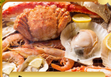
บึ่งย่างร้านดังนั้นตะ