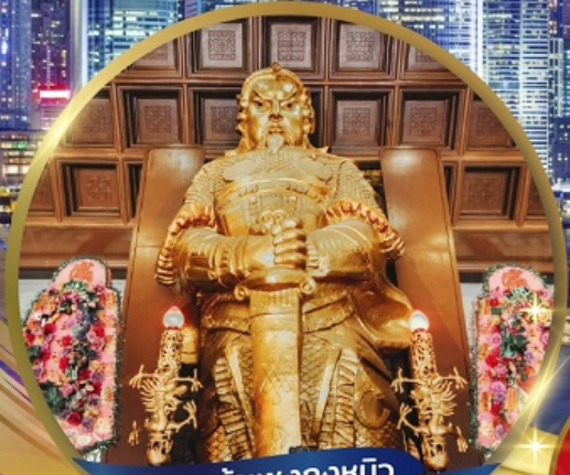
เทพเจ้าเขangkงหมิว (วัดเขangkงหมิว)