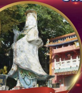
เจ้าแม่กวนอิมพรสิลเบย์