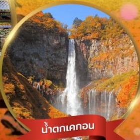
น้ำตกเคกอน