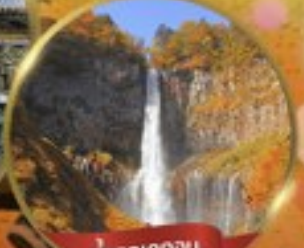
น้ำตกเคกอน