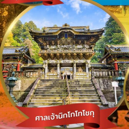
ศาลเจ้านิกโกโทโกโช