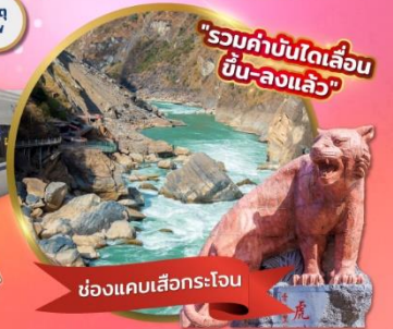
"รวมค่าบัตรรถไฟความเร็วสูง ขึ้น-ลงแล้ว"