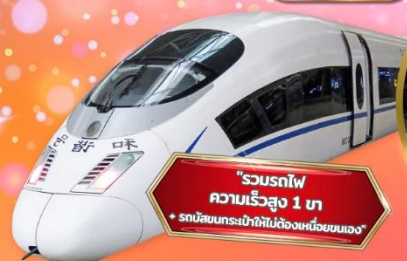
"รวมรถไฟ ความเร็วสูง 1 ขบวน + รถบัสชมธรรมชาติในท้องถิ่นพร้อมคนนำทาง"