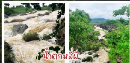
น้ำตกกลิ้งผี