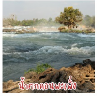
น้ำตกคอนพะเพ็ง