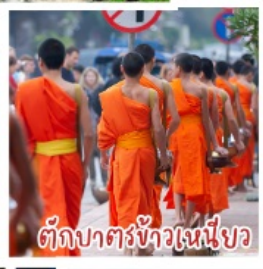
ตักบาตรข้าวเหนียว