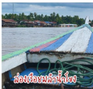
ล่องเรือชมลำน้ำโขง