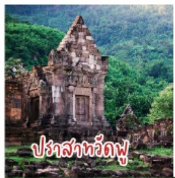
ปราสาทวัดพู