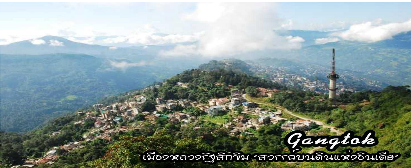
Gangtok เมืองหลวงรัฐสิกขิม “สวรรค์บนดินแห่งอินเดีย”

08.00 น. นำท่านออกเดินทางสู่ เมืองดาร์จีลิง - เมืองกันต็อก (Gangtok) ระยะทาง 96 ก.ม. ใช้เวลาเดินทางประมาณ 4-5 ชั่วโมง(ขึ้นอยู่กับจราจร) “เมืองกันต็อก” (Gangtok) เมืองหลวงแห่งรัฐสิกขิม “รัฐสิกขิม” (Sikkim) เมืองสายหมอก เป็นรัฐทางตอนเหนือของประเทศอินเดีย มีภูมิประเทศแบบที่ราบสูงบนเทือกเขาหิมาลัย มีพรมแดนติดกับหลายประเทศ อาทิ เขตปกครองตนเองทิเบต, เนปาล และภูฏาน แต่เดิมสิกขิมเป็นรัฐเอกราช มีขนาดใหญ่กว่ากรุงเดลี เมืองหลวงของอินเดียเล็กน้อย ปกครองโดยราชวงศ์นัมเเยล ด้วยความเป็นรัฐเอกราชเล็กๆ อาจถูก