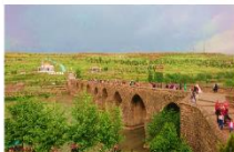
สะพานสิบโค้ง