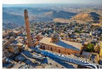
เมืองมาร์ดิน