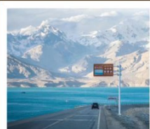
ทะเลสาบไป่ซาหู