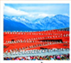
ไร่จางอวี๋ใหม่