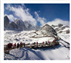
ภูเขาหินมังกรหยก

ลัดขีตมอดก / ไร่จรงเกนน้ำแยงซี / เมืองโบราณเซงกีสล่า / วัดลามซงจันหนิง / ซ่งเกนเส็งกรรไกร เมืองโบราณรุ่งทอ / ภูเขาหินมังกรหยก / ภูเขาพระเจดีย์สีน้ำเงิน / ไร่จางอวี๋ใหม่ สะพานมังกรดำ / สวนแก้วลี่เจียง / เมืองโบราณลี่เจียง ต้าหนิงทง / วัดหยวนทง