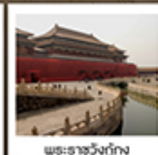
พระราชวังกู่กง