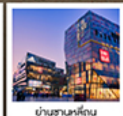
ย่านซานหลี่ตุ๋น