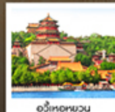
อวี่เหอหยวน

จัดรถเที่ยวอินเหมิน / พระราชวังโบราณกู่กง / หอบูชาเทียนถาน ถนนโบราณหนานหวิงกุเซียง / พระราชวังฤดูร้อนอวี่เหอหยวน วัดหลิงกวง / ย่านซานหลี่ตุ๋น / ศาลเมิ่งเจียงหนี่ / เกียร์มิงกร / วัดลามะ