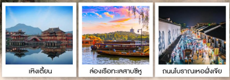
หึงเตี้ยน

ศูนย์ค้าส่งเมืองอี้อู / Hengdian World Studio / พระราชวังหมิงซิง พระราชวังจำลองจีนชื่อย่งเต้ / โรงภาพยนตร์ชิงหมิงซางเหอญู ถนนคนเดินกวางโจวและฮ่งกง / อุทยานสรวงสวรรค์เสียนเสวียจิว สะพานหฺรูอี้ / สะพานมังกร / ล่องเรือทะเลสาบซีหู / ห้าง INN77 ถนนโบราณเหอฝ่งเจีย / สะพานงเงิน / ถนนโบราณเสี่ยวเหอ