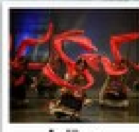
โรว์ทิเบต