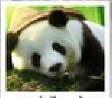
ดูแม่กบิ๊พเพนต้า

อุทยานหวงหลง / อุทยานจิ่วจ้ายโกว / ไร่ทิเบตดูม่อนบุ๊กรักแม่กบิ๊พเพนต้าดูเจียงเซี่ย / สวนดอกไม้ทิ่กู๋ / ระเบียบเก้ว / ถนนถนนเดินสูบซีง / ถนนโบราณจีนหนี่