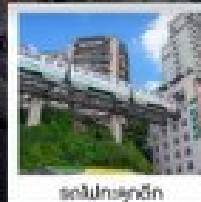
ตึกโมเดิร์น

ทัวร์คุณภาพ ไม่ลงร้านฮ้อปปีง • ไม่ขายออฟชั่น