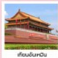
เขตเมืองปักกิ่ง