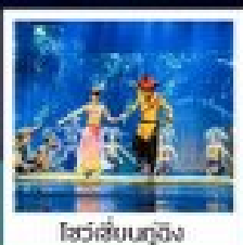
โชว์สีสันสุดปัง