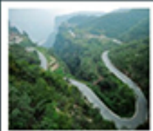
ไท่หิงซาน

หอซุนฮิว / ห้างสรรพสินค้าฟ้างวงหลาย เมืองโกเมิ่ง / สวนชิงหิงซ่างเหอหยวน โชว์ราชวงศ์ซ่ง / แกรนด์เกนยอนไท่หิงซาน หุบเขาดอกท้อ / ถนนลอยฟ้า หมู่บ้านทิวทัศน์ / 5๐๓ กำแพง ถ้ำหินหลงเหมิน / เมืองโบราณทงอี่ โชว์การแสดงวิทยาศาสตร์ล้ำสมัย