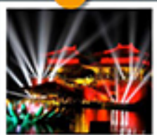
สวนชิงหิงซ่างเหอหยวน