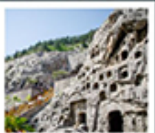
ถ้ำหินหลงเหมิน