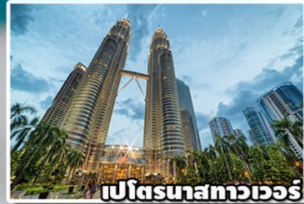
เปโตรนาสทาวเวอร์