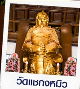
วัดเขกงหมิว