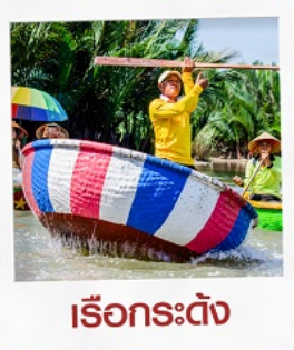
เรือกระดัง