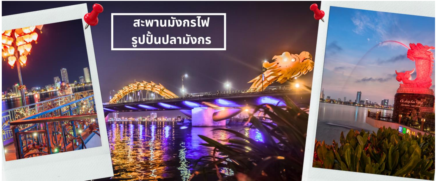
สะพานมังกรไฟ รูปปั้นปลามังกร

จากนั้นนำท่านชม สะพานแห่งความรัก ที่นิยมของหนุ่มสาวคู่รักกันมาซื้อกุญแจใส่คล้องใส่สะพาน จากนั้นนำท่านชม รูปปั้นปลามังกร ที่เป็นสัญลักษณ์ของเมืองดานัง เมืองที่กำลังจะกลายเป็นมังกรในระยะใกล้แห่งเอเชียตะวันออกเฉียงใต้ เชิญท่านเพลิดเพลินกับความอลังการของ สะพานมังกรไฟ ที่มีความยาวถึง 666 เมตร เป็นสะพาน 6 เลนส์ ซึ่งเป็นสะพานที่ตระการตามากที่สุดของเวียดนามในเวลานี้โดยการแสดงนี้จะเริ่มเวลา 21.00 น. ของวันเสาร์และอาทิตย์เท่านั้น