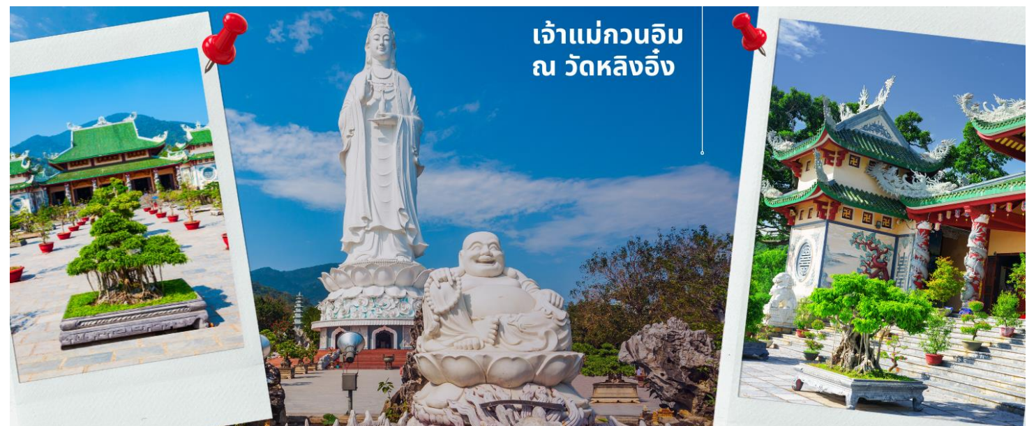
เจ้าแม่กวนอิม ณ วัดหลิงอิ่ง

เช้า รับประทานอาหารเช้า ที่ โรงแรม (2) นำท่านสักการองค์ เจ้าแม่กวนอิม ณ วัดหลิงอิ่ง อยู่บนเกาะเซินตรา (Son Tra) ทางเหนือของเมืองดานัง เป็นวัดใหญ่ที่สุดของที่นี่ รูปปั้นปูนขาวของเจ้าแม่กวนอิมยืนหันหลังให้ภูเขา หันหน้าออกสู่ทะเลเพื่อเป็นการปกป้องคุ้มครองชาวประมงที่ออกไปหาปลา เสียงระฆังวัดที่ตีประสานกับเสียงคลื่นนั้นช่วยให้ชาวเรือรู้สึกสงบ