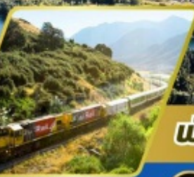
นักรดไฟฟราซึ อิลไฟน์