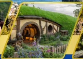
บ้านฮอบบิต