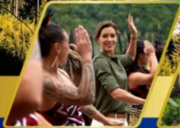
หมู่บ้านเมารี