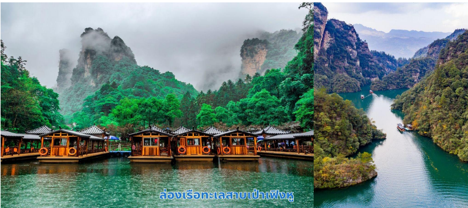
ล่องเรือทะเลสาบเป่าเฟิงหู

นำท่านเพลิดเพลินไปกับการล่องเรือชมความงาม ทะเลสาบเป่าเฟิงหู (Baofeng Lake) ทะเลสาบที่สวยงาม ด้วยน้ำที่เป็นสีเขียวเข้มราวกับเนื้อหยกโอบล้อมด้วยภูเขาหินรูปทรงประหลาดแปลกตาต่าง ๆ มากมาย เป็นทะเลสาบบนที่สูง ที่หาชมได้ยาก ได้รับการขึ้นทะเบียนเป็นมรดกโลกทางธรรมชาติ ในปี ค.ศ. 1992