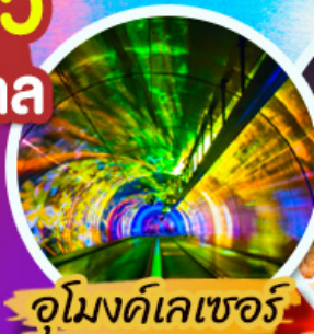
อุโมงค์เลเซอร์