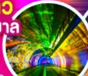
อุโมงค์เลเซอร์