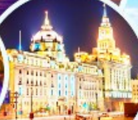
เดอะบันด์