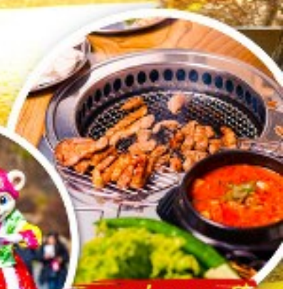
เมนูย่างเกาหลี