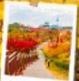
นัมซานพาร์ค