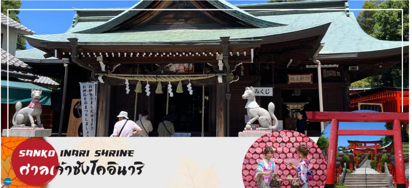
SANKO INARI SHRINE ศาลเจ้าซังโคอินาริ

จากนั้นนำท่านเดินทางสู่ ศาลเจ้าซังโคอินาริ (Sanko Inari Shrine) ตั้งอยู่ใกล้ๆ กับปราสาทอินุยามะ ศาลเจ้านี้มีชื่อเสียงเรื่องความรัก คู่รักมักจะมาขอพรให้มีความสัมพันธ์ที่ดี ชีวิตคู่ราบรื่น ครองรักกันยาวนาน ส่วนคนโสดก็จะขอให้ได้พบเจอคู่แท้จุดเด่นคือเสาโทริอิสีแดงที่เรียงรายสวยงาม และแผ่นป้ายขอพรรูปหัวใจสีชมพู ที่นี่ยังช่วยเรื่องการเงินอีกด้วย ว่ากันว่าถ้านำเงินมาล้างที่บ่อน้ำศักดิ์สิทธิ์ภายในศาลเจ้า จะช่วยให้เงินนั้นงอกเงยขึ้นหลายเท่า ครอบครัวเจริญรุ่งเรือง