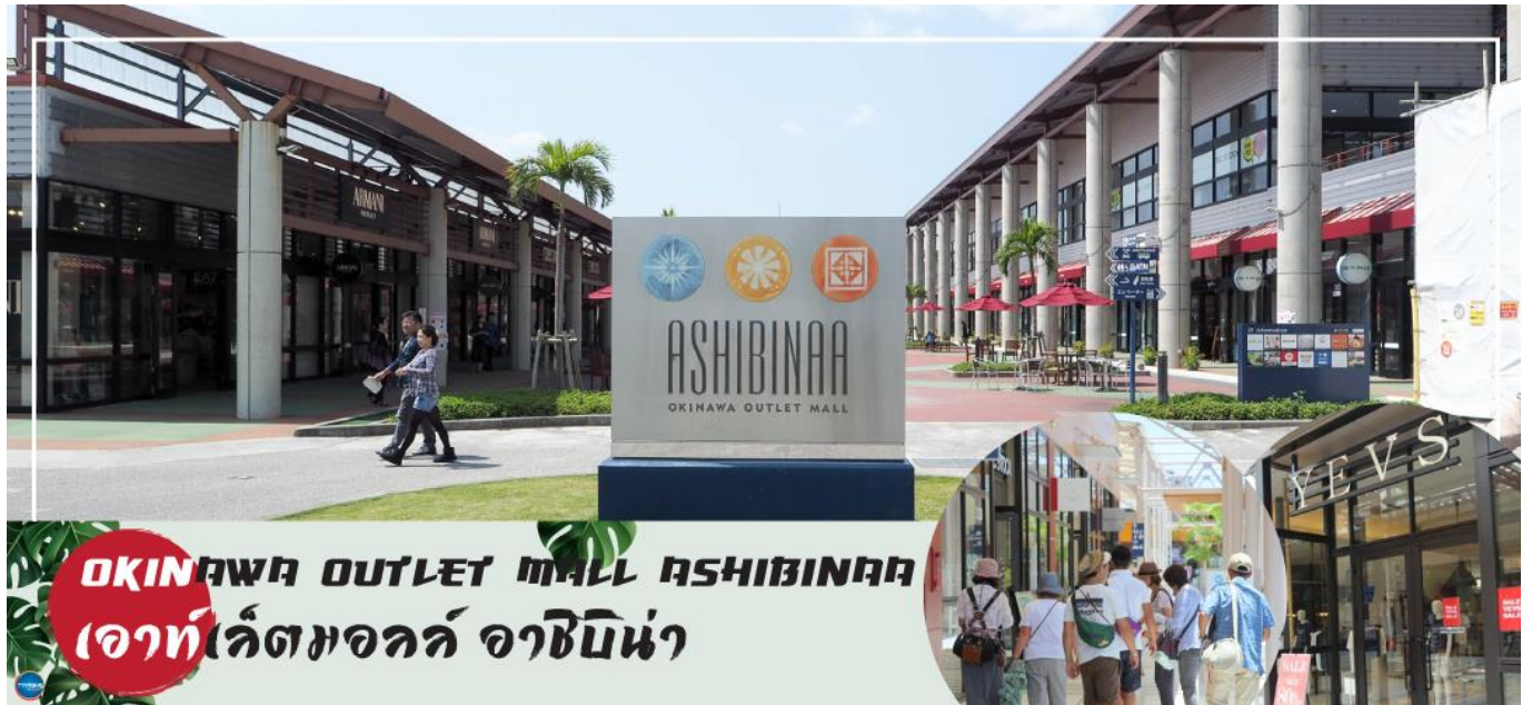
OKINAWA OUTLET MALL ASHIBINAA เอาท์เลตมอลล์ อาชิบิโน่า

เช้า รับประทานอาหารเช้า ณ ห้องอาหารของโรงแรม (5) นำท่านเดินทางสู่ ศาลเจ้านามิโนะอุเอะ (Naminoue Shrine) (ใช้เวลาเดินทางประมาณ 10 นาที) ตั้งอยู่ ณ บริเวณที่เป็นพื้นที่ศักดิ์สิทธิ์ที่ใช้ในการสวดภาวนาอธิษฐานต่อเทพเจ้าที่สถิตย์อยู่ ณ อาณาจักรเจ้าสมุทรโพ้นทะเลมาแต่ครั้งโบราณ ในอดีตชาวเรือที่เข้าออก ณ ท่าเรือนาสะ (Naha Port) ซึ่งขณะนั้นเป็นศูนย์กลางการแลกเปลี่ยนค้าขายกับนานาประเทศ ทั้งจีน ประเทศทางตอนใต้ เกาหลี และชวายามาโตะ มักจะแหงนหน้ามองขึ้นไปยังศาลเจ้าซึ่งตั้งอยู่บนหน้าผาสูงเพื่ออธิษฐาน และแสดงความขอบคุณ ศาลเจ้านามิโนะอุเอะได้รับความเสียหายจากการรบในโอกินาวะ (Battle of Okinawa) เมื่อครั้งสงครามแปซิฟิก แต่ได้รับการบูรณะฟื้นฟูในเวลาต่อมาเมื่อสงครามสิ้นสุดลง ปัจจุบันนี้ได้กลายมาเป็นศูนย์กลางแห่งศาสนาชินโตในจังหวัดโอกินาวะ ชาวญี่ปุ่นมักจะมาไหว้ขอพรเกี่ยวกับธุรกิจการงานให้เจริญรุ่งเรือง ร่ำรวย และมาสะเดาะเคราะห์ให้พ้นโชคร้าย จากนั้นนำท่านสู่ เอาท์เลตมอลล์ อาชิบิโน่า (Okinawa Outlet Mall Ashibinaa) (ใช้เวลาเดินทางประมาณ 30 นาที) เอาท์เลตแห่งแรกในโอกินาวะ รวบรวมร้านค้าชั้นนำกว่า 100 ร้าน ทั้งเสื้อผ้าแฟชั่น สินค้าแบรนด์เนม นาฬิกา ข้าวของเครื่องใช้ ของเล่น ทุกร้านจัดเต็มทั้งสินค้านำเข้าและรุ่นใหม่ ลดราคากระหน่ำกว่า 30-80% ให้ได้เดินช้อปปิ้งท้ายทวีปกันอย่างจุใจ ภายใต้บรรยากาศสบายๆ สไตล์รีสอร์ทริมทะเล หากช้อปปิ้งเหนื่อยสามารถขึ้นไปทานอาหารที่ชั้น 2 มีอีกหลายร้านที่คอยให้บริการ