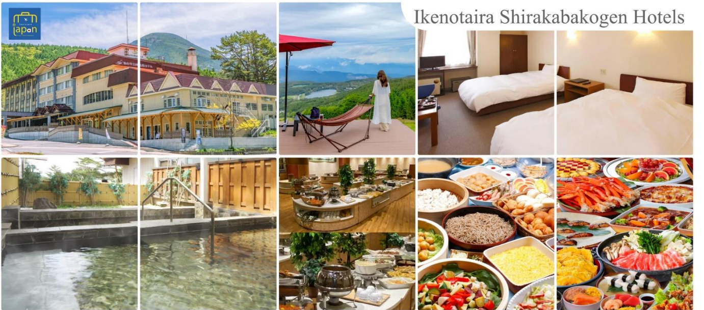
Ikenotaira Shirakabakogen Hotels

หลังอาหารให้ท่านได้ผ่อนคลายกับการแช่น้ำแร่ธรรมชาติ เชื่อว่าถ้าได้แช่น้ำแร่แล้ว จะทำให้ ผิวพรรณสวยงามและช่วยให้ระบบหมุนเวียนโลหิตดีขึ้น