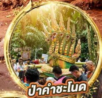
ปราสาทคำชะโนด