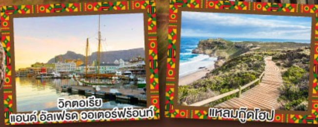
วิกตอเรีย แอนด์ อัลเฟรด วอเตอร์ฟรอนท์

เปิดประสบการณ์กับกตาคาร Canivore สวรรค์ของคนรักเนื้อสัตว์