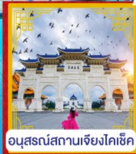
อนุสรณ์สถานเจียงไคเช็ค