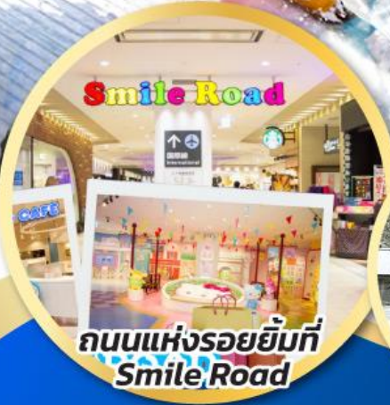
ถนนแห่งรอยยิ้มที่ Smile Road