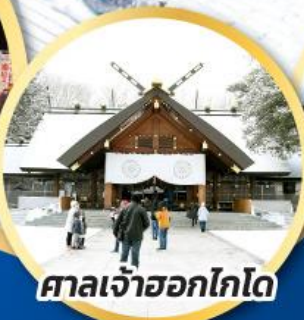
ศาลเจ้าฮอกไกโด