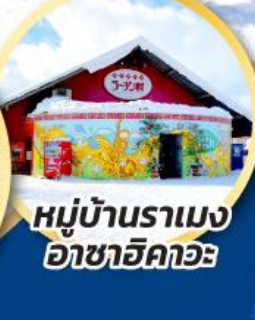
หมู่บ้านราเมง อาซาฮิคาวะ

ชมความน่ารักของน้องๆ ที่สวนสัตว์อาซาฮิคาวะ