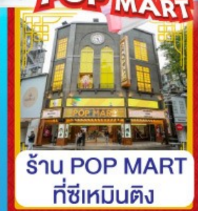
ร้าน POP MART ที่ซีเหมินติง