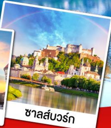
ซาลส์บวร์ก