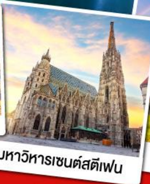
มหาวิหารเซนต์สตีเฟน