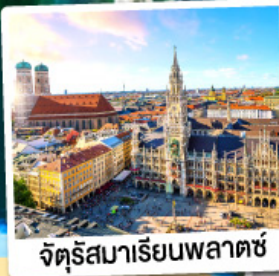
จัตุรัสมาเรียนพลาตซ์

15-21 ต.ค. 67 28 ก.พ.-06 มี.ค. / 12-18 มี.ค. 68 28 มี.ค.-03 เม.ย. / 03-09, 10-16 เม.ย. 68 25 เม.ย.-01 พ.ค. / 29 เม.ย.-05 พ.ค. 68