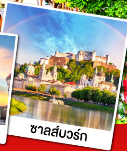
ซาลส์บวร์ก