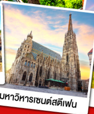
มหาวิหารเซนต์สตีเฟน