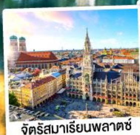
จัตุรัสมาเรียนพลาตซ์

15-21 ต.ค. 67 28 ก.พ.-06 มี.ค. / 12-18 มี.ค. 68 28 มี.ค.-03 เม.ย. / 03-09, 10-16 เม.ย. 68 25 เม.ย.-01 พ.ค. / 29 เม.ย.-05 พ.ค. 68