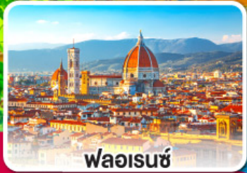
ฟลอเรนซ์

จะพาสต้า, พิชซ่า หรือสปาเก็ตตี้ คงจะดีถ้าได้กินกับเธอ