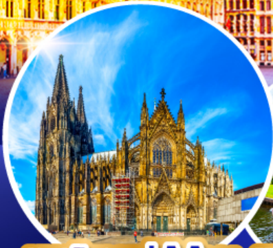
มหาวิหารแห่งโคโลญ หมู่บ้านกีธูร์น