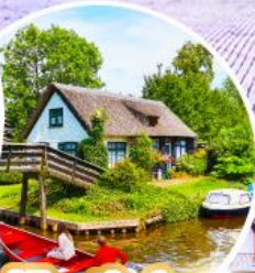
หมู่บ้านกีร์ซัน