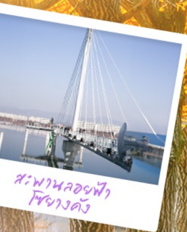
สะพานลอยฟ้า โซยางคัง