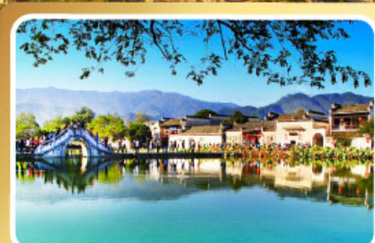
หมู่บ้านผดงโลก หงซุน