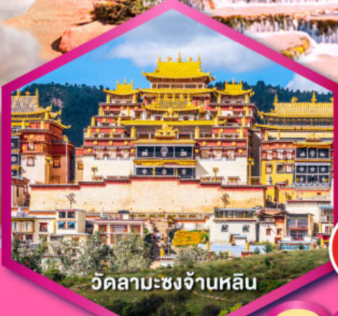
วัดลามะชงจ้านหลิน