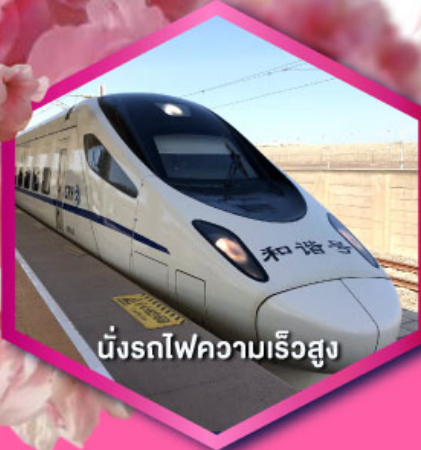
นั่งรถไฟความเร็วสูง