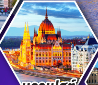
บูดาเปสต์