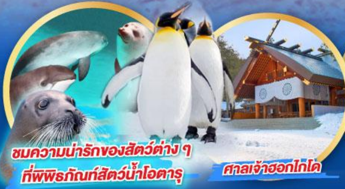
ชมความน่ารักของสัตว์ต่าง ๆ ที่พิพิธภัณฑ์สัตว์น้ำโฮตารุ