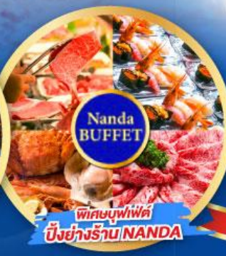
พิเศษบุฟเฟต์ บึงย่างร้าน NANDA

เดินทาง (วันปีใหม่ 2568) 27 ธ.ค.-01 ม.ค. 68 29 ธ.ค.-03 ม.ค. 68