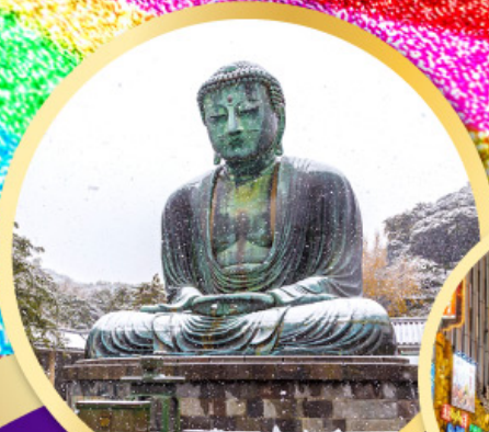
หลวงพ่อโตโคบูตสึ