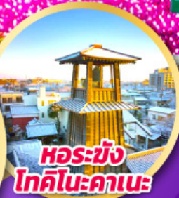
หอรบั้ง โทคิโนะคานะ