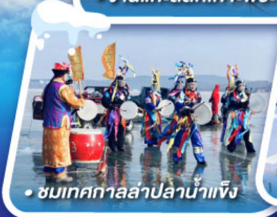
• ชมเทศกาลล่าปลาน้ำแข็ง