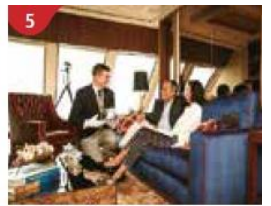
5 The Palace Indulge in European-style butler service and exclusive facilities.