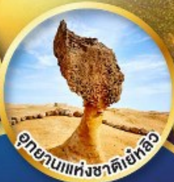
อุทยานแห่งชาติเย้หลิว