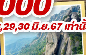
เทวหลิงซาน