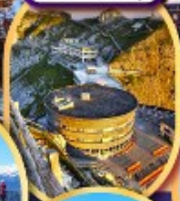
ยอดเขาพิลาตุส