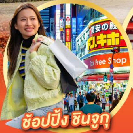
ช้อปปิ้ง ซินจุกุ