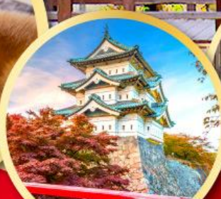
ปราสาทอิโรซากิ